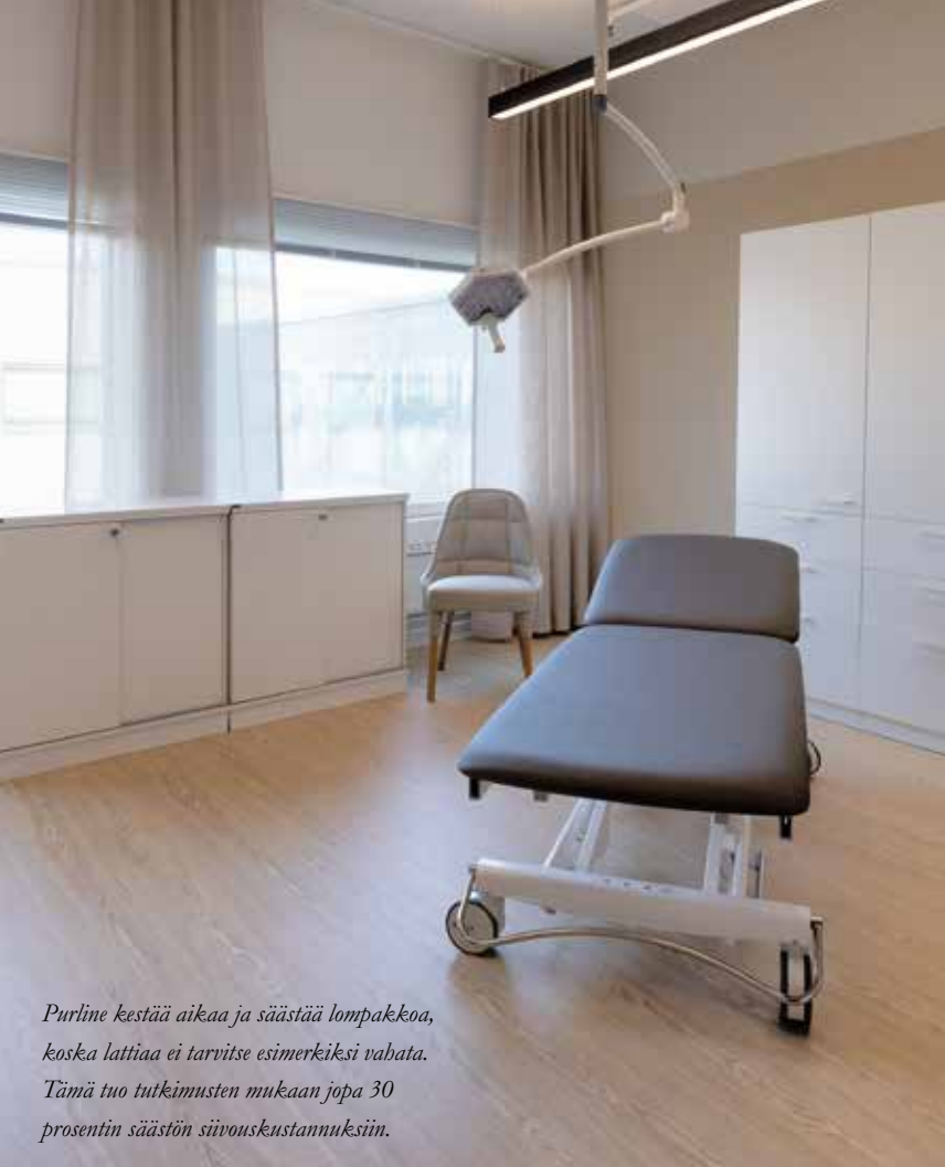
Purline kestää aikaa ja säästää lompakkoa, koska lattiaa ei tarvitse esimerkiksi vabata. Tämä tuo tutkimusten mukaan jopa 30 prosentin säästön siivoukustamuksiin.