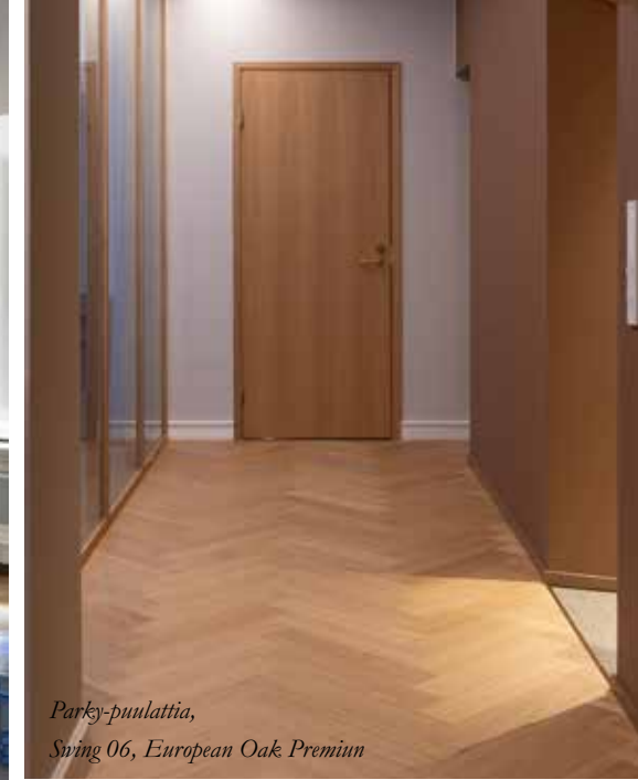
OpenOcean toimisto Suunnittelu: Mint & More Creative