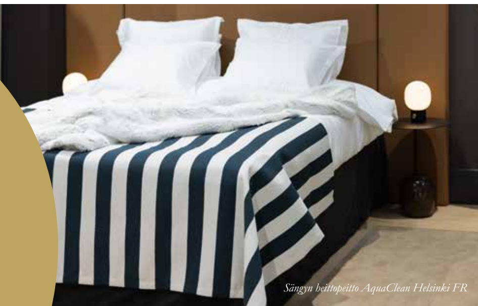
Sängyn heittopeitto AquaClean Helsinki FR