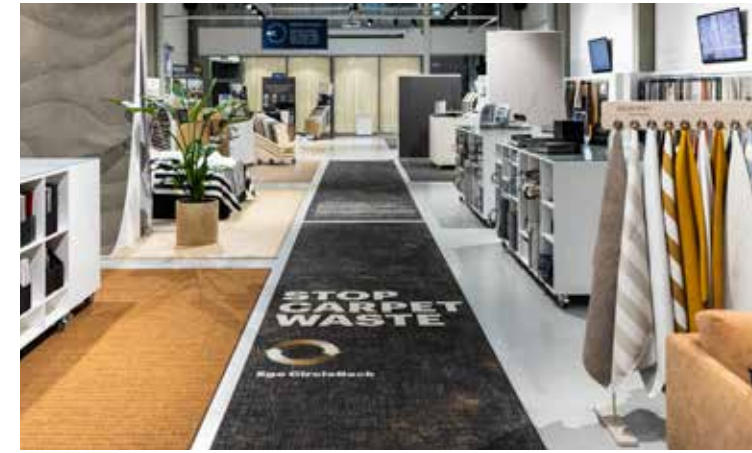
Organoid on Orient Occidentin valikoimissa materiaalinuutus, joka tarjoaa moniaistillisen, luonnon materiaaleja juhlittavan elämyksen.