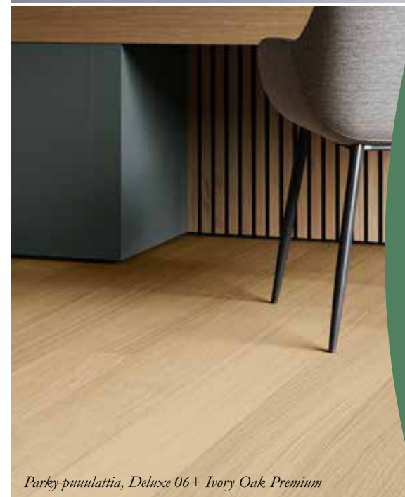
Parke-puuulattia, Deluce 06+ Ivory Oak Premium