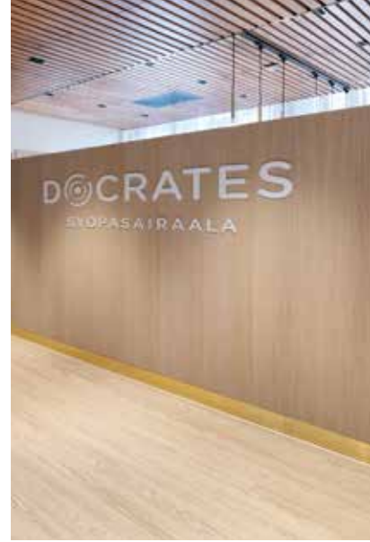
Docrates Syöpäsairaalaan on asennettu Purline 1500 Wood L Classic oak Spring -lattia.

”Haimme helposti puhdistettavaa, kosteutta ja roiskeita kestävästä materiaalista, joka ei ime likaa tai orgaanisia aineita. Kokemuksemme mukaan Purline täyttää nämä vaatimukset”, sairaalan kehitysohjohtaja Harri Puurunen sanoo.