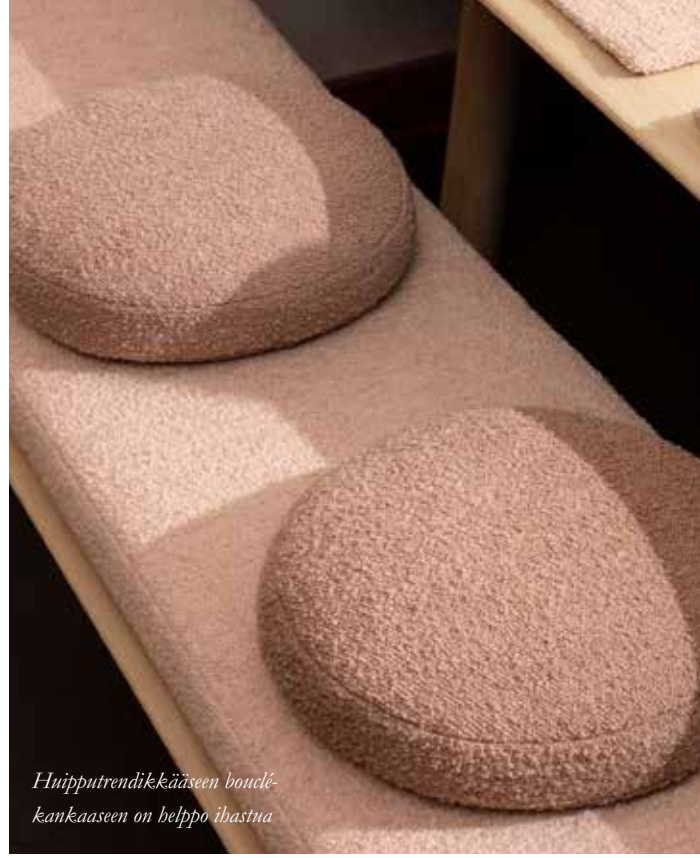
Huipputrendikkääseen bouclé-kankaaseen on helppo ihastua

Kauden kangastreendeissä toistuvat nyt pörröisyys ja pehmeys, mikä tuo eloisuutta ja vaihtelua julkisiin tiloihin. Muhkea struktuuri kiinnittää katseen ja tekee tilasta helposti lähestyttävän – olipa kyseessä hotelli, ravintola tai vaikkapa toimisto. Samalla kenties arjen hektisyys jää hetkeksi taka-alalle ja syke tasaantuu pehmeiden kankaiden syleilyssä.