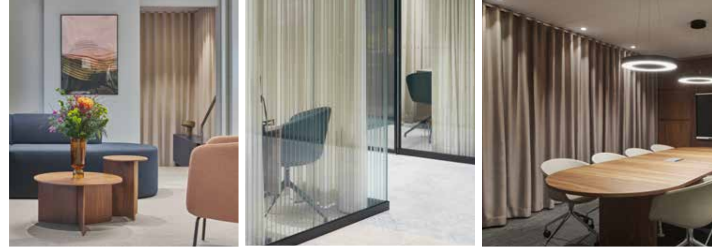
Lammin Säästöpankki, suunnittelu Scope Design Oy

Kirkby Designin lisäksi myös Zinc tarjoaa pörröisen vaihtoehdon runsaiden linjojen ystäville. Zincin Sheepskin-kangas sopii julkisiin tiloihin, joihin haetaan maksimaalista pehmeyttä. Ylellisen upottava, kosketusaistia hellivä kangas on aitoa lampaanvillaa. ●