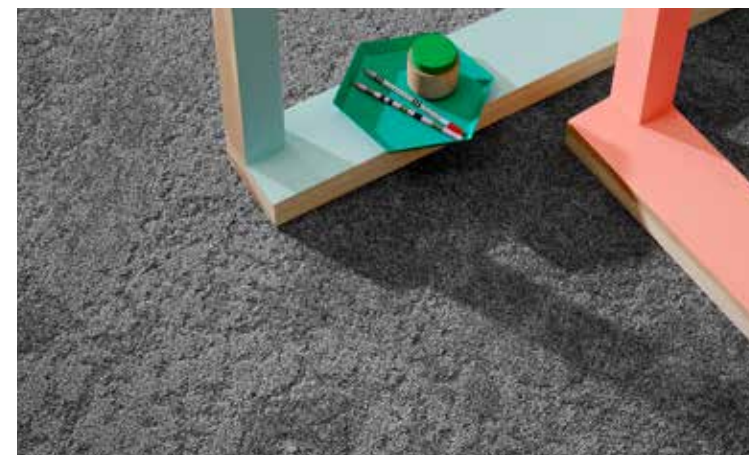
Sculptured Forms -mattolaattojen ulkoasut ovat elegantteja ja klassisia, moniin erilaisiin tyyliin sopivia. Hillityt kuosit korostavat tilan muita arkkitehtonisia piirteitä. Sculptured Forms on saatavissa suoraan Orient Occidentin varastosta 6 eri sätyssä.

– Tilaus- ja varastovalikoimastamme löytyy runsas joukko erilaisia kuoseja ja sävyjä. Yhteysttä vaan tännepäin, me autamme valintojen kanssa mielellämme, Vainio vinkkaa. ●