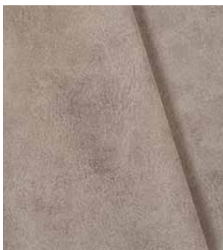
EETTINEN HAASTAJA NUPUKKINAHALLE - AQUACLEAN BISON FR

Helsinki FR on kunnianosoitus vähäeleiselle ja vahvan geometriselle skandinaaviselle designille. Kankaan kudonta muistuttaa bukleta, eli sen pinta on eläväinen sekä katsottaessa että koskettaessa. Saatavissa 10 kauniissa väri-ssä: luovia sävy-yhdistelmiä huonekalujen verhoiluun sekä heittopeittoihin ja -tyynyihin!