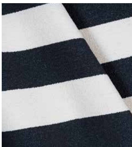
TASARAIDAN JUHLAA - AQUACLEAN HELSINKI FR

Erinomaisesti muun muassa hotellien, ravintoloiden sekä toimisto- ja tapaturmatilojen verhoilutarpeisiin soveltuva AquaClean on vahvistanut viime vuosina suosiotaan myös Suomessa. Eikä ihme, sillä kankaat kestävät kauniina erittäin pitkään, jopa vuosien ajan. Lisäksi niiden hoito on ainutlaatuisen helppoa ja kustannustehokasta. Nyt pelkällä vedellä puhdistuvien ja paloturvallisten AquaClean-kankaiden valikoima on kasvanut kolmella hurmaavalla uutuuksella.