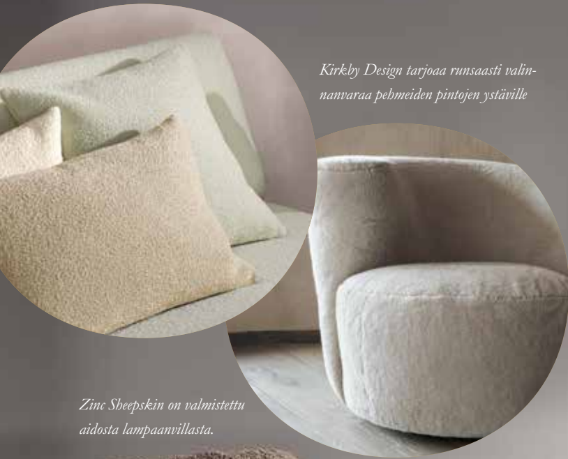
Kirkby Design tarjoaa runsaasti valinnanvaraa pehmeiden pintojen ystäville

Kun tyyli ja tuntuma ovat keskenään täydellisessä sopuinnussa, kokonaisuus on omaa luokkaansa. Romon sisustusankaissa korostuvat juuri nyt runsaat struktuurit. Lisäksi ystävälliset vuosien takaa tekevä näyttävän paluun: tervetuloa huipputrendikäs bouclé!