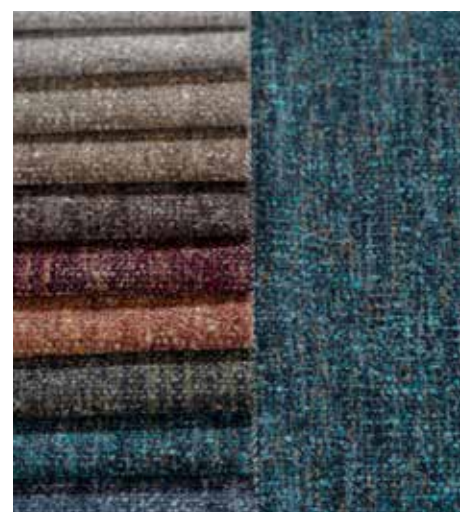
ELÄVÄISEN KIEHTOVIA KUOSEJA - AQUACLEAN FABIA FR

Bison FR on flokkikangas, joka on tuntu- maltaan ja ulkoasultaan nupukkinahan kal- tainen. Vastuullisesti valmistettu kangas päi- hittää perinteisen eläinperäisen materiaalin ainutlaatuisilla teknisillä ominaisuuksillaan. Saatavissa 30 upeassa sävyssä.