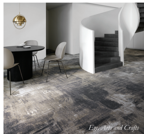
Ege, Arts and Crafts

Highline Express Arts & Crafts on yksi Ege Carpetsin myydyimmistä mallistoista. Myös se on saanut innoitustaan luonnosta, jossa kaikkea on epätäydellisen täydellistä.