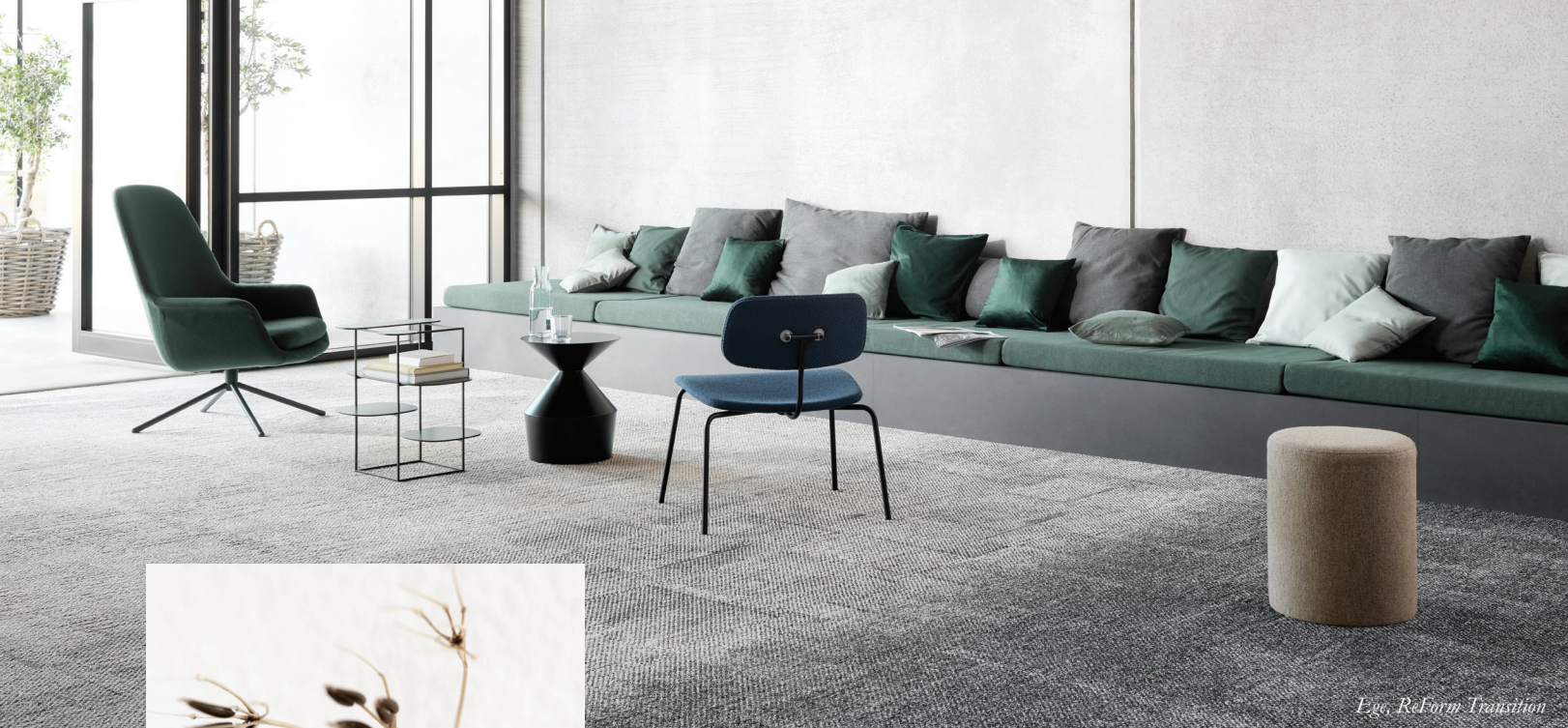
Ege, ReForm Transition