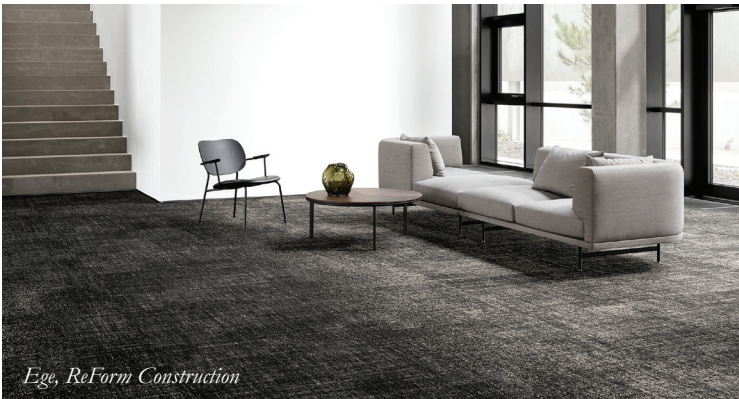
Ege, ReForm Construction