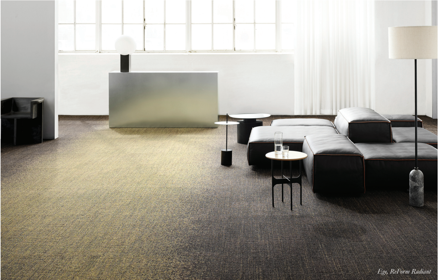
Ege, ReForm Radiant