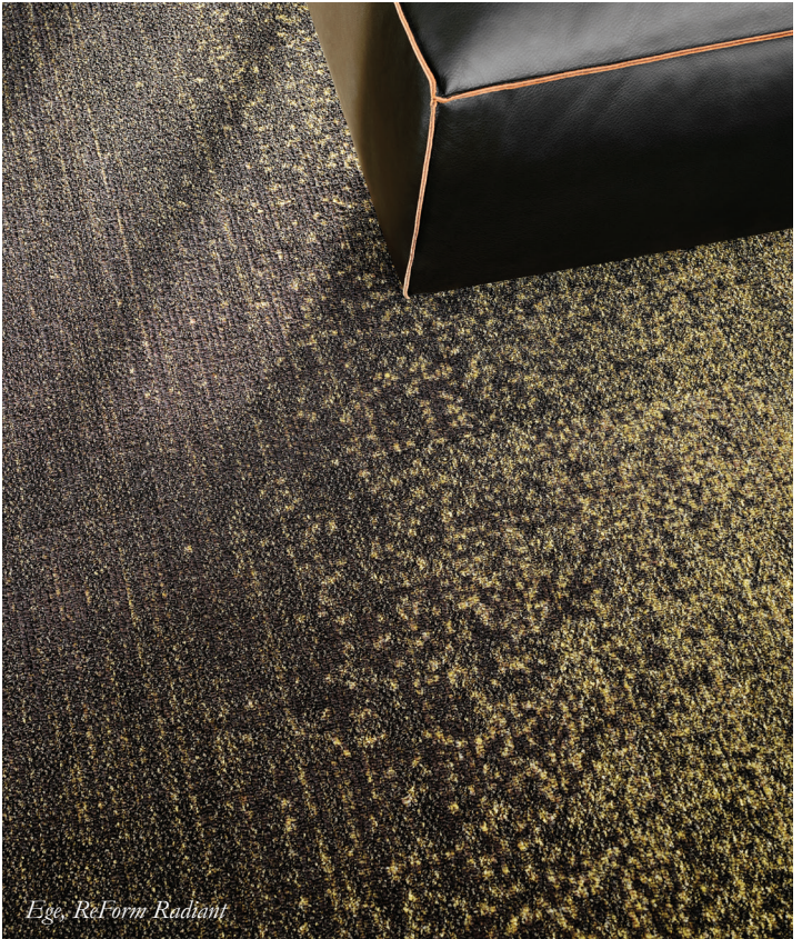
Ege, ReForm Radiant