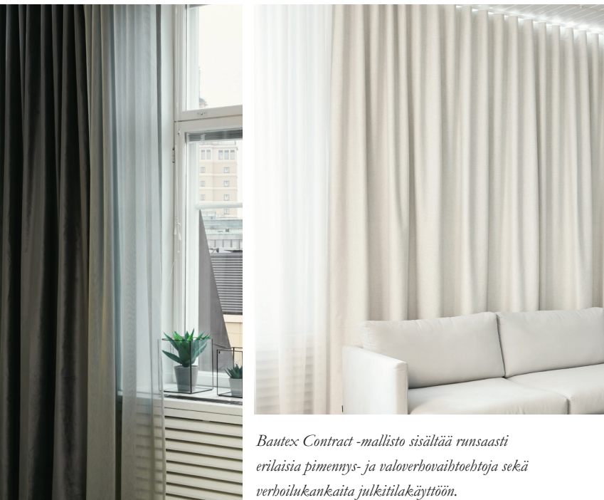
Bautex Contract -mallisto sisältää runsaasti erilaisia pimennys- ja valoverho vaihtoehtoja sekä verhoilukankaita julkitilakäyttöön.