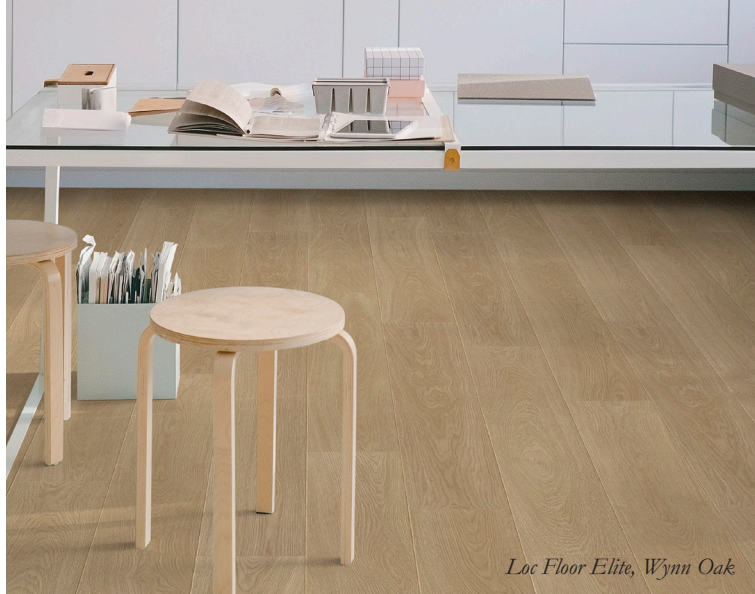
Loc Floor Elite, Wynn Oak