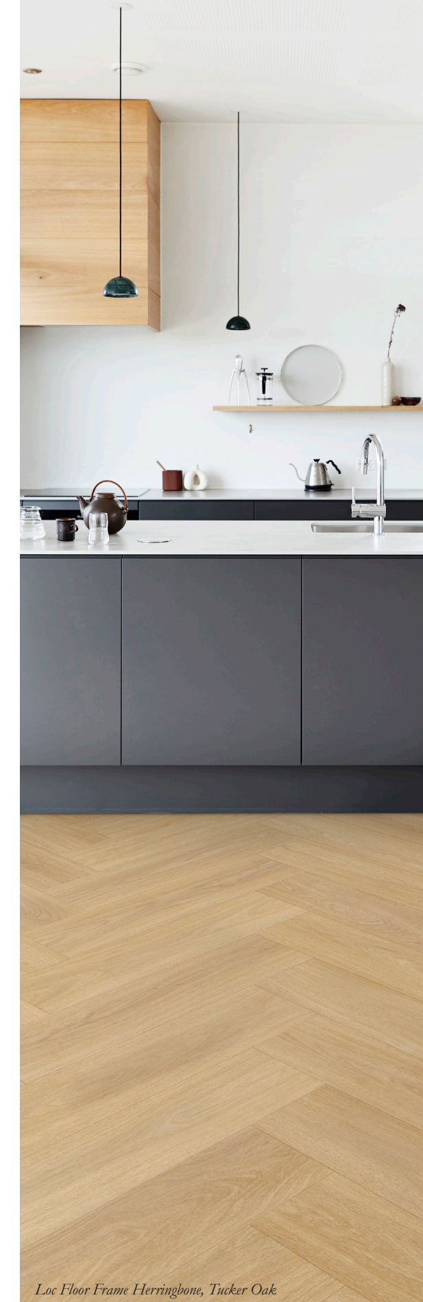
Loc Floor Frame Herringbone, Tucker Oak

TUTUSTU UUSIIN LOC FLOOR -KUOSEIHIN JA TEKNIISIIN OMINAISUUKSIIN TARKEMMIN: orientoccident.fi