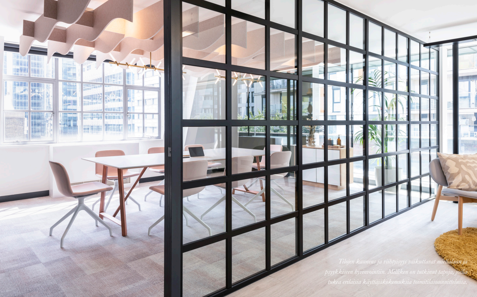
Tilojen kauneus ja viihtyisyys vaikuttavat mielialaan ja psyykkiseen hyvinvointiin. Milliken on tutkinut tapoja, joilla tukea erilaisia käyttäjäkokemuksia toimitilasuunnittelussa.