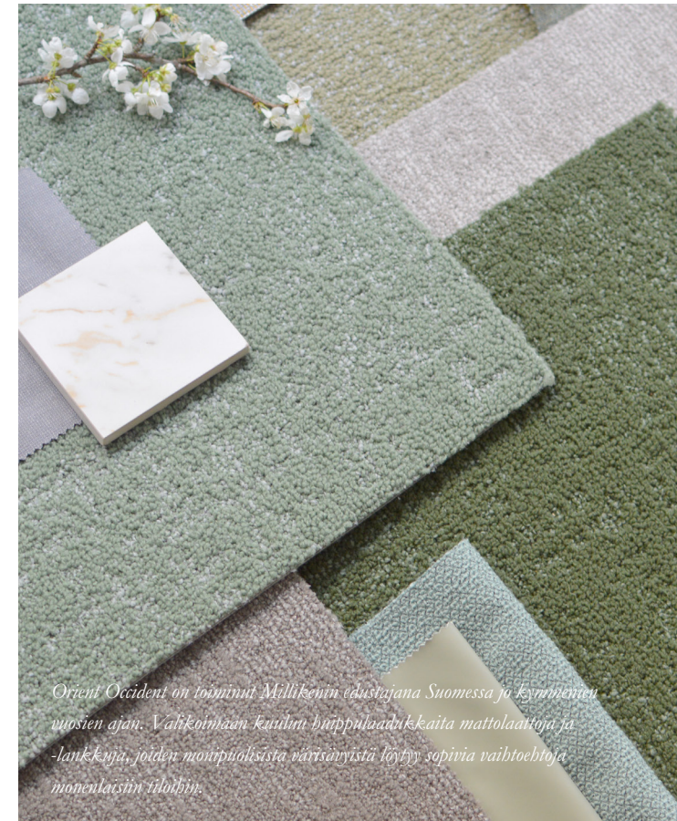
Orient Occident on toiminnut Millikenin edustajana Suomessa jo kymmenen vuosien ajan. Valikoimaan kuuluu hiippulaadukkaita mattolaattuja ja -lankkugia, joiden monipuolisista väri- ja tekstiilivaihtoehtoja löytyy sopivia vaihtoehtoja monenlaisiin tiloihin.

– Jopa 15–20 % aikuisista on neuroepätyypillisiä, ja luku on kasvussa. Korona-ajan etätyössä monille kirkastui omat, yksilölliset tarpeet työtehon optimoinnin kannalta. Lisäksi ne, jotka ovat kouluaikoina saaneet neuroinklusiivista tukea, ovat siirtyneet ja siirtymässä työelämään. Neuroepätyypillisuus huomioidaan koulutuksessa, miksipä sitä ei tuettaisi työelämässä?