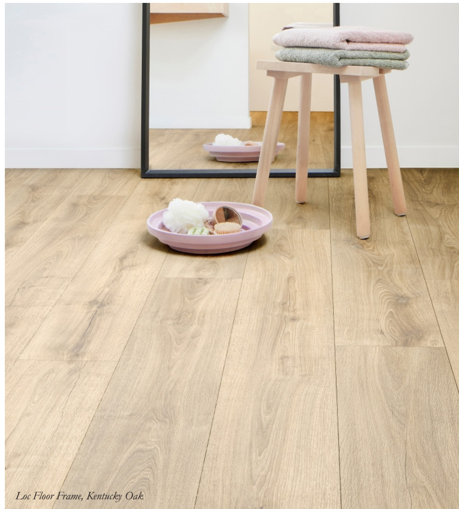
Loc Floor Frame, Kentucky Oak

Keväällä 2024 Orient Occidentin valikoimiin saapunut kolmikko avaa suunnittelijalle inspiroivia mahdollisuuksia pitkäikäisten ja kauniiden lattiapintojen luomiseen.