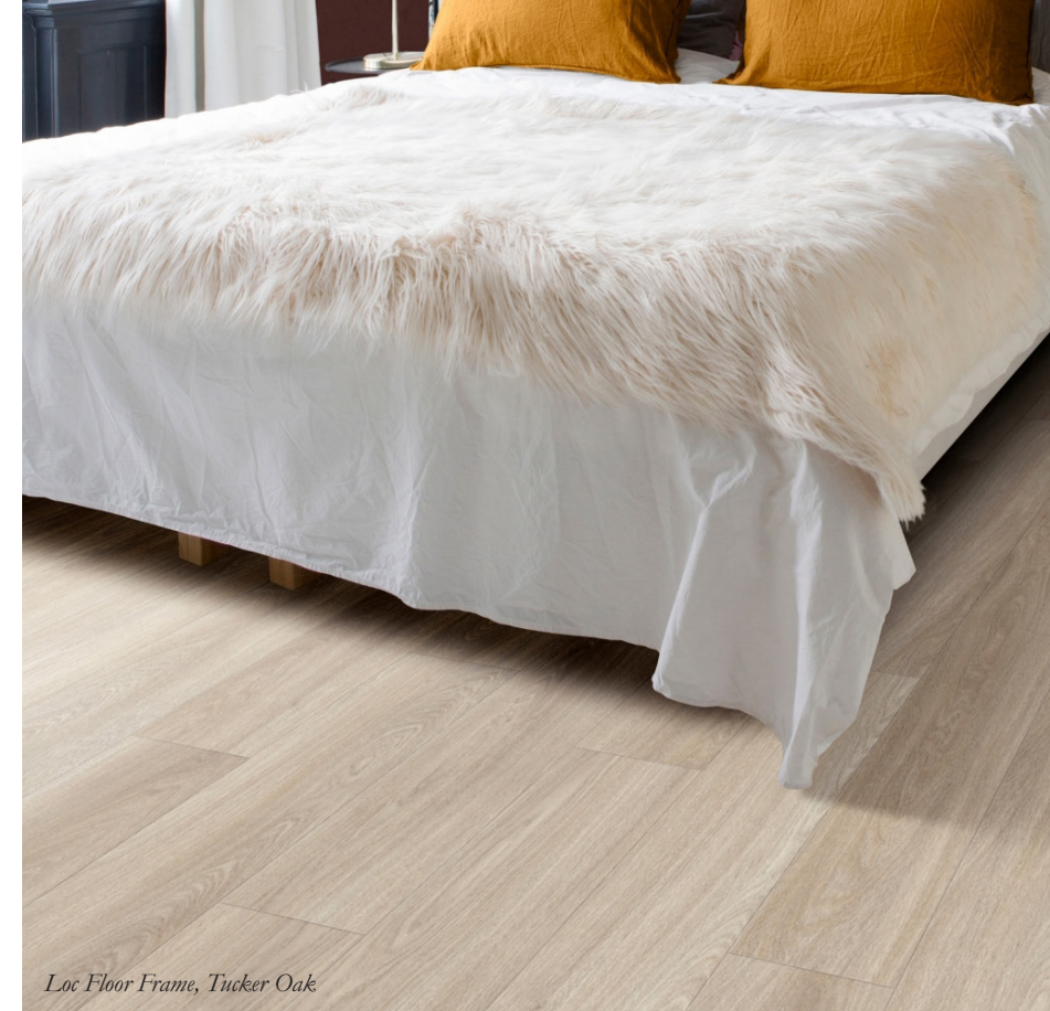
Loc Floor Frame, Tucker Oak

– Modernia minimalismia tai perinteisempää tunnelmaa, molemmat onnistuu. Valittavissa on seitsemän erilaista tammikuosia. Puukuosien nyanssit jatkuvat reunaviisteisiin asti, mikä korostaa valmiin lattiapinnan saumatonta yhtenäisyyttä. Laminaatti kestää myös suoraa kosteusaltistusta jopa 24 tuntia, Juha kertoo.